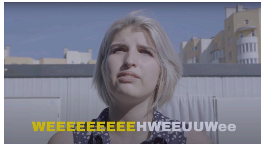
オープングループ《繰り返してください》2022

第8回横浜トリエンナーレ「野草：いま、ここで生きてる」は、わたしたちに、災害や戦争、環境破壊、経済格差、不寛容など世界が抱えている多くの課題を投げかけます。展示作品には、息苦しさの中をたくましく生き抜こうとするひとりの人間の姿が映し出されています。右は、ウクライナのアーティスト「オープングループ」の作品です。スクリーンに映し出される武器の音を口で再現する人々の姿は、生きるために新たな知識が必要となったウクライナの今ある現実を生々しく伝えています。展覧会鑑賞を通して、今日の社会的な問題を考えるきっかけにしてください。