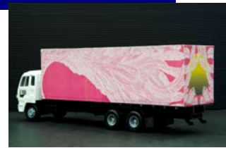
やなぎみわ 台湾の移動舞台トレーラー(写真は32分の1の模型) 2014