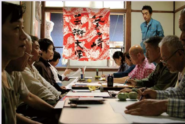
釜ヶ崎芸術大学 絵画の授業の様子

釜ヶ崎芸術大学のおっちゃんたちが日々の講座で生み出したもっとも大切な数々の「作品」。