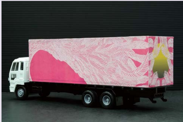
やなぎみわ 台湾の移動舞台トレーラー(写真は32分の1の模型)2014

2001年の横浜トリエンナーレにも参加したやなぎみわ氏が台湾で制作したデコトラ(移動舞台車)の外装作業をサポーターが手伝います。