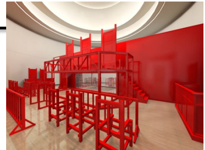
《法と星座・Turn Coat / Turn Court》(完成予想図) 2014 © satoru takahashi

「日本国憲法」をDJやラッパーが演奏するなか、各回異なる“事件”の審議が執り行われます。