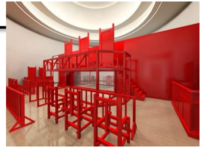
《法と星座・Turn Coat / Turn Court》(完成予想図) 2014 © satoru takahashi

「日本国憲法」をDJやラッパーが演奏するなか、各回異なる“事件”の審議が執り行われます。